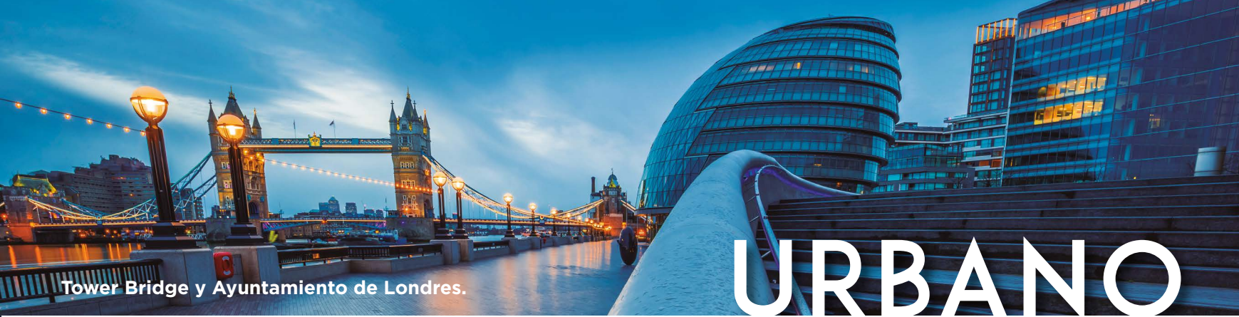
Tower Bridge y Ayuntamiento de Londres.