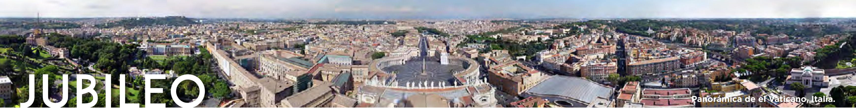
Panorámica de el Vaticano, Italia.