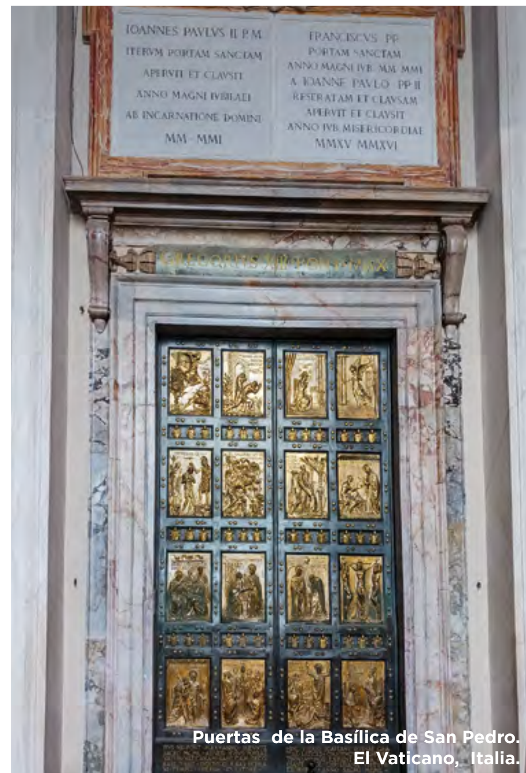
Puertas de la Basílica de San Pedro. El Vaticano, Italia.

Desayuno. A la hora prevista, traslado al aeropuerto. Y con una cordial despedida, diremos... ¡Hasta pronto!