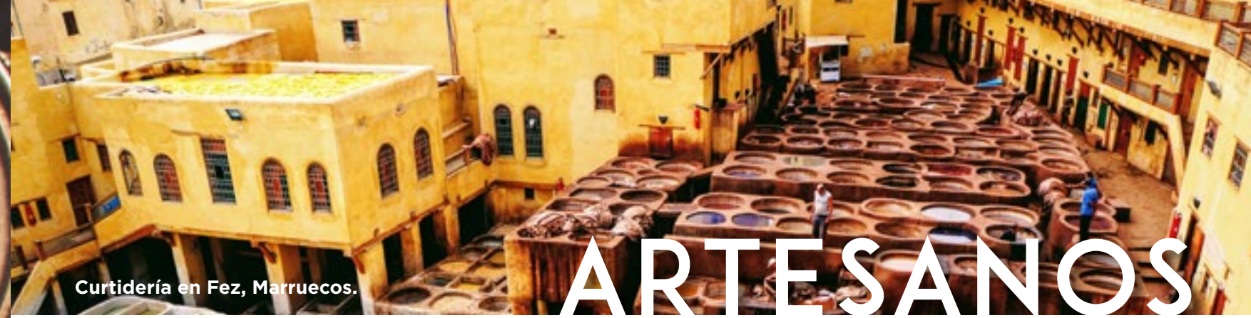
Curtidería en Fez, Marruecos.