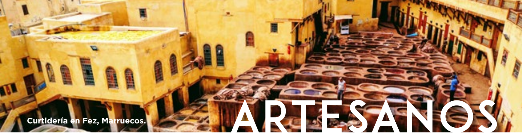
Curtidería en Fez, Marruecos.