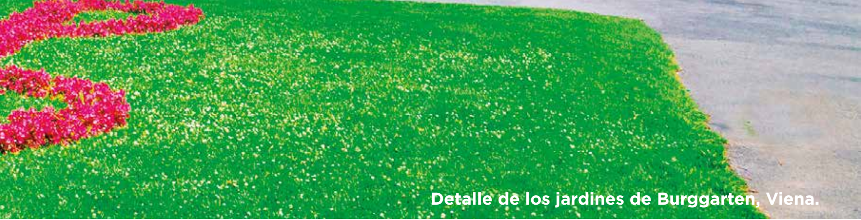
Detalle de los jardines de Burggarten, Viena.

PISA - NIZA - BARCELONA - ZARAGOZA - MADRID