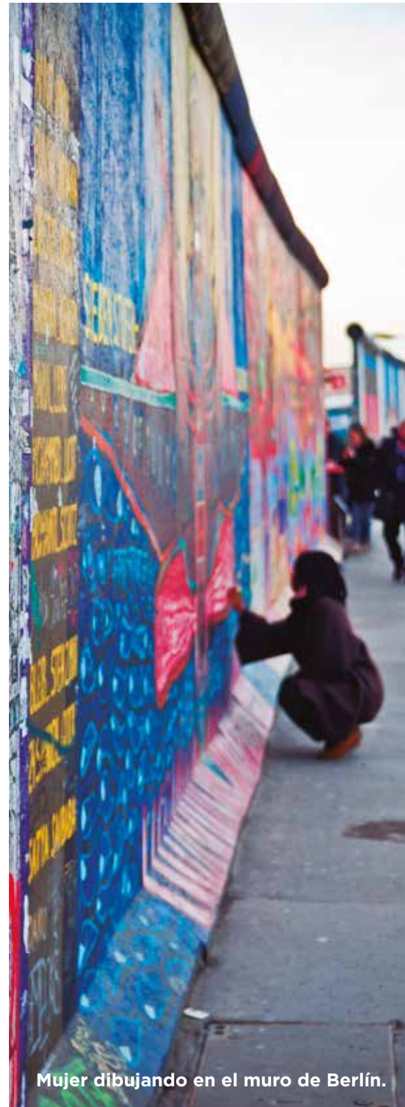
Mujer dibujando en el muro de Berlín.