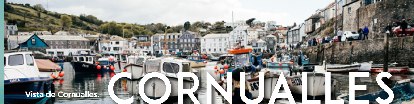
Vista de Cornualles.