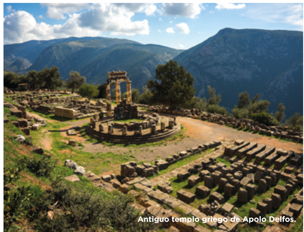
Antiguo templo griego de Apolo Delfos.

Desayuno. A la hora acordada realizaremos el traslado al aeropuerto. Y con una cordial despedida, diremos... ¡Hasta pronto!