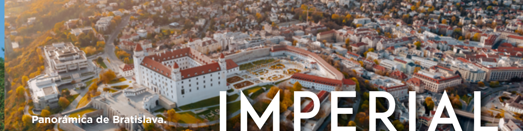
Panorámica de Bratislava.

Royal Coster Diamonds · Paulus Potterstraat 2-6 1071 CZ Amsterdam · The Netherlands +31 (0)20 305 5555 · support@costerdiamonds.com www.costerdiamonds.com