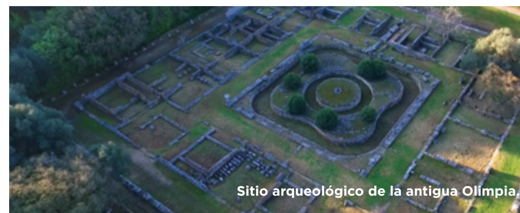
Sitio arqueológico de la antigua Olimpia.

Desayuno y, a continuación, visita de la ciudad antigua de Olympia , centro de veneración de Zeus, donde en la antigüedad se celebraban las famosas competiciones